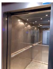
Ascenseur tour Iroise après remplacement